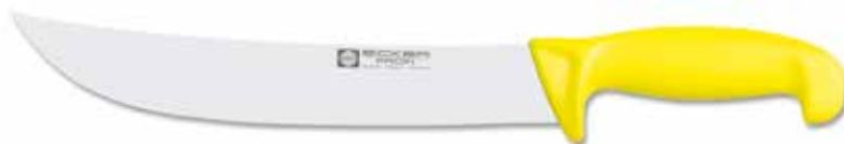
Blockmesser amerikanische Form/Butcher Knife American style Cuchillo de carnicero estilo american