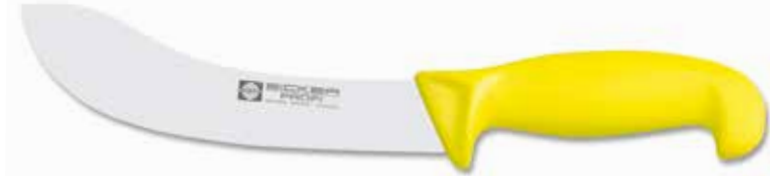
Hautmesser/Skinning Knife Cuchillo Desollador