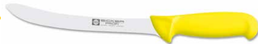
Filiermesser/slicer Cuchillo para filetar