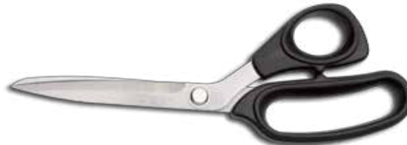
Geflügelschere/Poultry Shears/Tijeras aves de corral