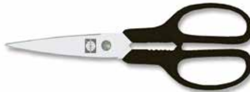
Haushaltsschere rostfrei/Houshold Scissors stainless/Tijera hogar/inoxidable